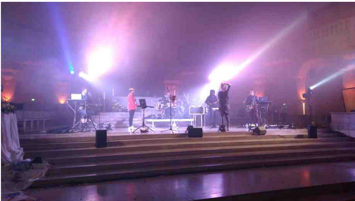
Belle ambiance au concert d'Alegria.

Merci Seigneur pour ces incroyables moments, pour toutes les fabuleuses rencontres que j'ai pu faire, pour Ta présence tout au long de ce festival ! Et un grand merci aux mamans qui étaient présentes pour encadrer ce groupe de la Paroisse ! ●