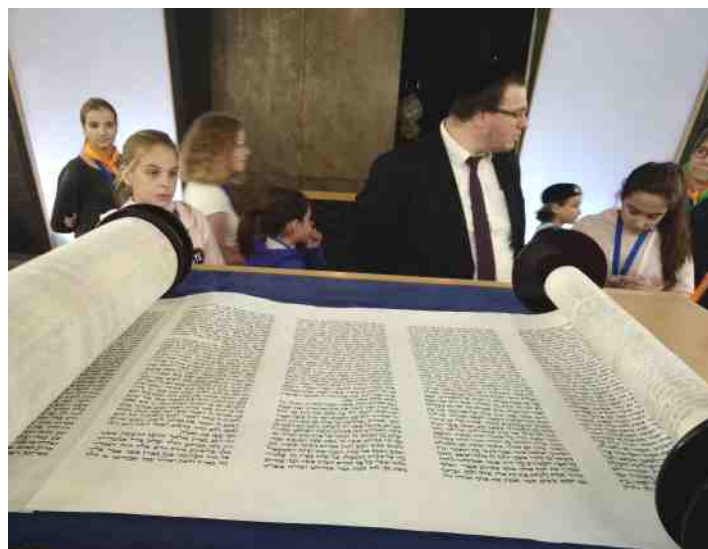
Le rabbin à la synagogue.

Pendant les vacances de la Toussaint, j'ai participé au rassemblement Ephata. On était beaucoup de jeunes du Diocèse. On a fait plein de jeux, de prières, de temps de frat'. C'était trop bien ! À recommencer ! ▶