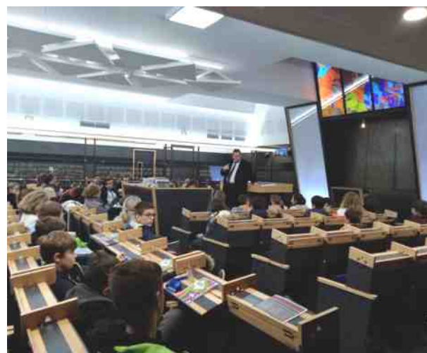
Ci-contre : les participants de Saint-Loup.